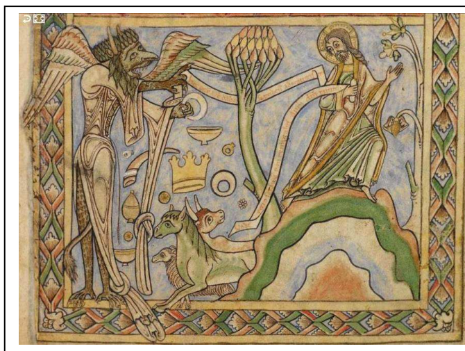
3. ábra: Winchesteri Psaltérium v. Blois-i Henrik herceg psaltériuma, 1250-es évek.