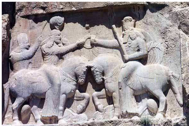
2. ábra: Ormuzd megbízza Ahrimánt, képforrás: http://www.absoluteastronomy.com/topics/Ahura_Mazda