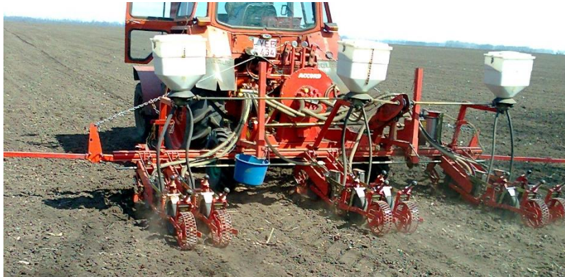
1. Ábra. Vetés menete precíziós vetőgéppel Forrás: saját felvétel

A talajelőkészítés és tápanyagutánpótlás hasonló módon történt, vetés előtt 500 kg Volldünger Granulátum Plussz 14-10-20 NPK tartalmú műtrágyát dolgoztunk be. A vetést (4 ha-os felületen) április 27-én végeztük, az 1. ábrán látható pneumatikus rendszerű szemenkénti vetőgéppel. lkorsoros elrendezésben (135 + 25 cm) a tőtávolság 17 cm volt, így 70.000 csíra/ha vetőmagot juttattunk ki 2 cm mélységben. Ezzel a művelettel egybekötve 15 kg/ha Force fonálféreg irtására alkalmas talajfertőtlenítőt adagoltunk. Vetést követően 10 mm-es kelesztő öntözést biztosítottunk, majd néhány nap múlva 18 mm-es természetes csapadék biztosította az egyenletes kelést. A növényápolás a palántázotthoz hasonló technológiai elemekből állt.