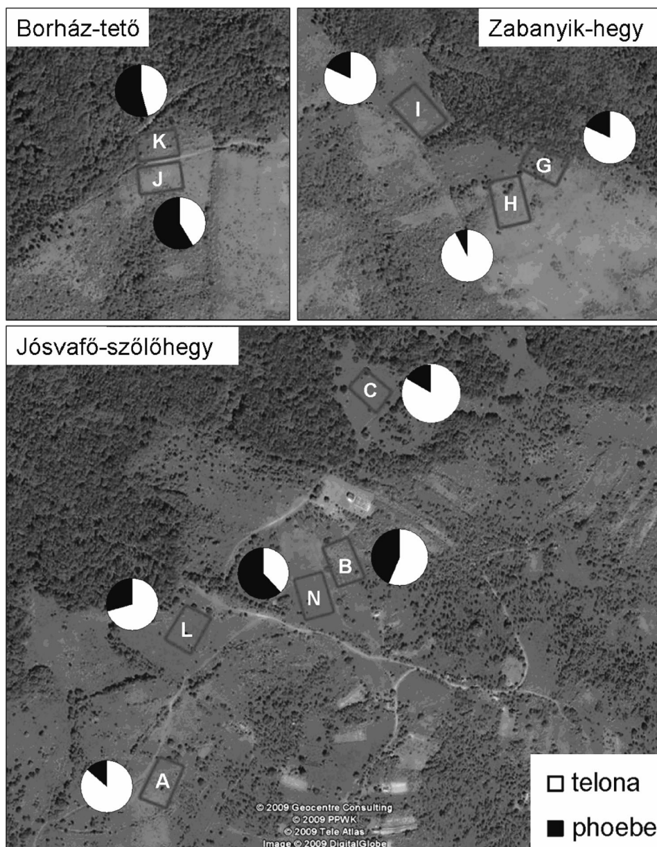
1. ábra. A mintavételi helyek topográfiája, valamint a M. phoebe (fekete) és M. telona (fehér) megfigyelt arányai.

hasnólóan a jósvafői Szőlőhegyhez. Növényzetét és nappali lepke-együttesét az előbbivel összehasonlítva, szárazabb, melegebb élőhelynek látszik. Ennek a területnek egyes fajgazdag gyepfoltjai valószínűleg edafikus okok miatt eredendően