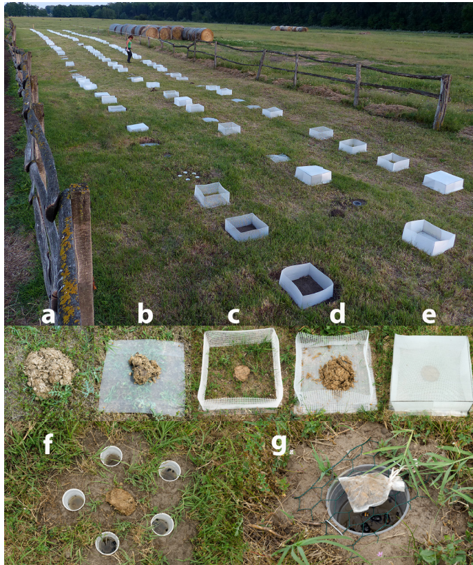
1. ábra. A bugaci mintaterület. A kép alján láthatók az egyes fő kizárási típusok, zárójelben a kezelések sorszámával: (a) nincs kizárás (1), (b) alagútásók kizárása (2, 3), (c) galacsinhajtók kizárása (4, 5), (d) mindkettő kizárása (6, 7, 8, 9), (e) az összes csoport kizárása (10, 11), valamint az alkalmazott talajcsapdázási módszerek (f) T5, (g) T1.

a területeken, ahol nem élnek galacsinhajtók (lokális kistérségek vagy nagyobb régiók, pl. Észak-Európa), az ő kizárásukra irányuló kezelések elhagyhatók. Az alagútásók trágyaelhordását 40×40 cm-es műanyag rács alátéttel, a galacsinhajtókat ugyanekkora alapterületen, 15 cm magas kerítéssel akadályoztuk meg, míg a társbérloket 40×40×15 cm-es zárt ketreccel rekesztettük ki (1. ábra). A kizárások kombinációja összesen 11 féle kezelést eredményezett a teljesen szabadon levő trágyakupactól a teljesen zárt ketreccben levőig. Az alkalmazott rács lyukátmérője 1 cm, illetve 1 mm volt, előbbi csak a nagy, utóbbi a nagy és kis fajokat egyaránt kizárta. (1. táblázat). A területen jelen levő három legeltetett patásfaj (ló, marha, juh) trágyáját külön-külön vizsgáltuk, a kezeléseket trágyatípusonként 6 ismétlésben végeztük ( 3 \times 6 \times 11 = 198 ). Egy vizsgálati ciklus ideje egy hónap, esetünkben ez június elejétől július elejéig tartott.