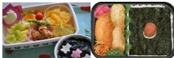
Rajah 8: Noriben Bento

Rajah 7 ialah Bento yang mempunyai kandungan telur, ikan salmon, acar dan buah ume ialah Makunouchi Bento .