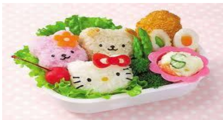
Rajah 2: Contoh bento yang siap didekorasi