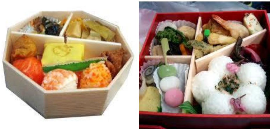
Rajah 17: Ekiben

Rajah 16 menunjukkan Hayaben bento . Hayaben bento dikenali sebagai hidangan makanan tengahari.