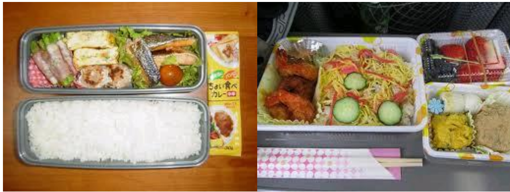
Rajah 16: Hayaben

Rajah 16 menunjukkan Hayaben bento . Hayaben bento dikenali sebagai hidangan makanan tengahari.