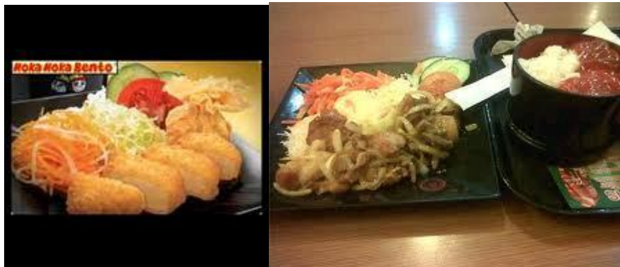
Rajah 15: Hokaben

Rajah 14 ialah Reito Mikan adalah Bento berisi buah limau.