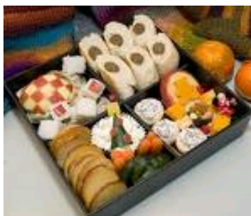
Rajah 4: Shokado Bento

Hidangan bento mempunyai pelbagai jenis dan mempunyai gaya dekorasi yang begitu teliti dengan gaya kyaraben atau (karakter bento ). Watak-watak kartun popular Jepun ( anime ), watak dari buku komik ( manga ) sering dilihat pada bento. Bento yang dihiasi seperti manusia, haiwan, bangunan dan tumbuh-tumbuhan adalah antara jenis bento yang popular. Berikut adalah jenis-jenis bento yang bentuknya sangat unik dan menarik (Sri Setyaningsih, 2011).