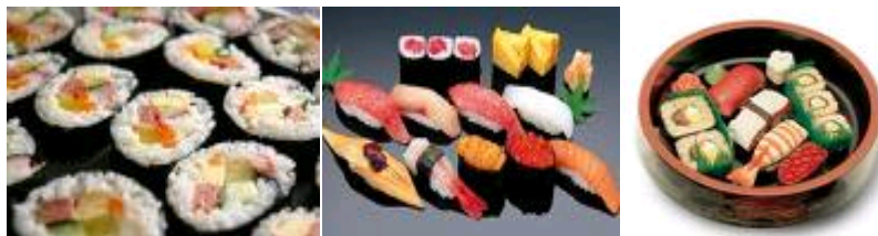
Rajah 11: Shushizume Bento

Rajah 10 ialah Bento yang di makan pada waktu tengahari dan dihidangkan di kedai makan dikenali sebagai Shidashi .