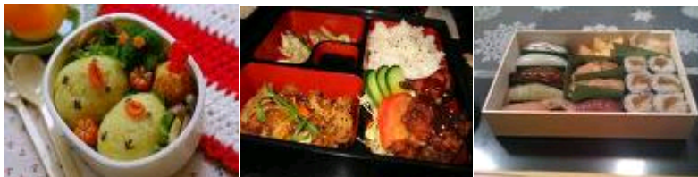
Rajah 12: Tori Bento

Rajah 11 menunjukkan Shushizume adalah Bento sushi