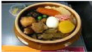
Rajah 6: Kamameshi Bento

Rajah 5 adalah masakan china berisi bento dikenali sebagai Chuka Bento .