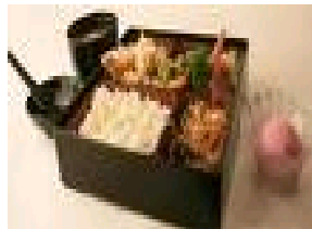
Rajah 7: Makunouchi Bento

Rajah 6 menunjukkan Kamameshi Bento yang terdapat di stesen keretapi sebagai jualan kepada pelanggan untuk mengalaskan perut dalam perjalanan.