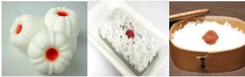
Rajah 13: Hinomaru Bento

Rajah 13 ialah Bento berisi buah umeboshi diletakkan ditengah ialah Hinomoru Bento .