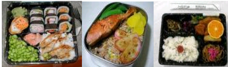
Rajah 10: Shidashi Bento

Rajah 9 ialah Bento yang diisi dengan ikan salmon yang telah dipanggang yang dikenali sebagai Shake Bento .