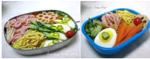
Rajah 5: Chuka Bento

Rajah 5 adalah masakan china berisi bento dikenali sebagai Chuka Bento .