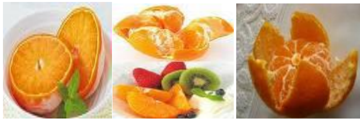
Rajah 14: Reito Mikan

Rajah 13 ialah Bento berisi buah umeboshi diletakkan ditengah ialah Hinomoru Bento .