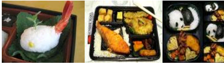
Rajah 9: Shake Bento

Rajah 9 ialah Bento yang diisi dengan ikan salmon yang telah dipanggang yang dikenali sebagai Shake Bento .