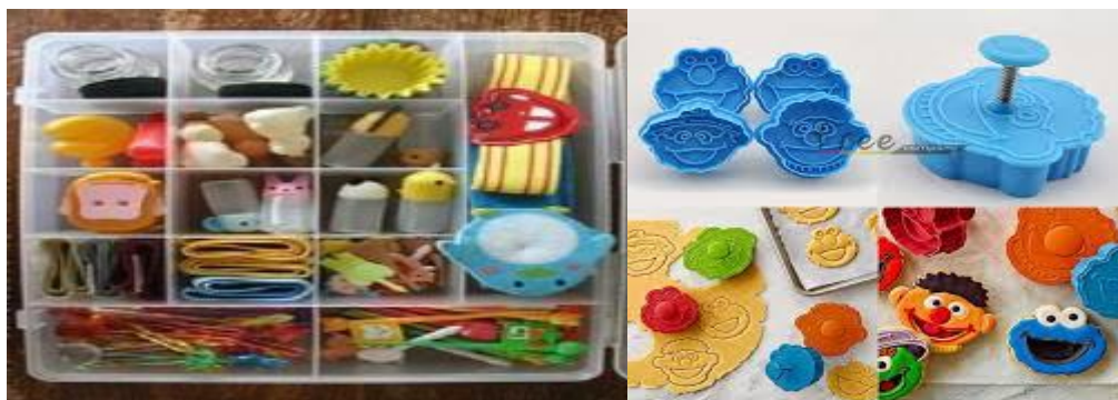
Rajah 3: Acuan Bento