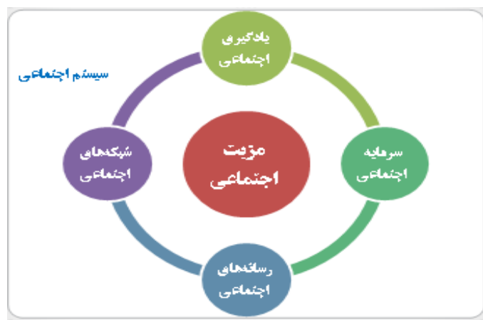
شکل ۱. ابعاد مدیریت دانش اجتماعی

همان‌طور که در شکل (۱)، نشان داده شده است مدیریت دانش اجتماعی به‌عنوان یک سیستم در نظر گرفته شده که دیگر ابعاد آن را نیز شامل می‌شود. از آنجایی که مدیریت دانش اجتماعی به‌عنوان یک سیستم اجتماعی در نظر گرفته می‌شود. بنابراین، هر سیستم دارای مجموعه‌ای از عناصری هستند که به‌صورت یک کل در نظر گرفته می‌شوند. در نتیجه در سیستم مدیریت دانش اجتماعی، اعضای گروه باید دارای ویژگی‌های زیر باشند. اول این‌که، هدف مشترکی داشته باشند و از حداکثر توانایی‌های خود برای رسیدن به اهداف گروهی استفاده کنند. در مرحله دوم همه اعضا احساس مسئولیت فردی و جمعی داشته و وظایف فردی و گروهی خود را به نحو احسن انجام دهند. سوم این‌که، اعضای گروه با یکدیگر در ارتباط بوده و از طریق بیان تجارب و دیدگاه‌های خود به افزایش دانش جمعی کنند و به‌صورت جمعی یکدیگر را به موفقیت در این زمینه تشویق کنند. در مرحله چهارم، همه اعضای گروه مهارت‌های اجتماعی لازم را برای برقراری ارتباط با دیگران را داشته باشند و از این طریق بتوانند به ارزیابی تجارب، دیدگاه‌ها و نظرات دیگران بپردازند. به‌طور کلی در سیستم‌های مدیریت دانش اجتماعی همه ابعاد بر روی یکدیگر تأثیر می‌گذارند و از همدیگی تأثیر می‌پذیرند. لذا همه اعضا باید برای رسیدن به موفقیت گروهی