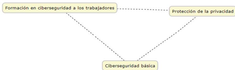
Imagen 1. Elementos clave para la ciberseguridad en bibliotecas. Fuente: Elaboración propia.