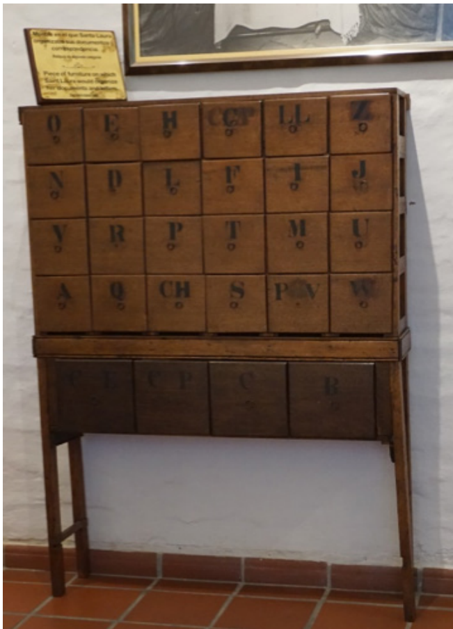
Figura 1. Archivador madre Laura.