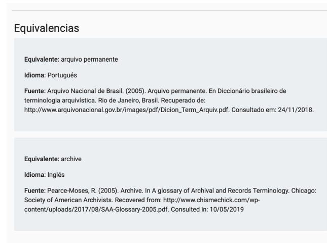
Figura 3. Equivalentes en inglés y portugués del término archivo histórico .

to, casos como el del término archivo ilustran bien esta problemática. En efecto, el equivalente en inglés, según el glosario de la Sociedad Americana de Archivistas, es archives , en plural, mientras que archive corresponde en el contexto colombiano a archivo histórico . La Figura 3 ilustra este caso.