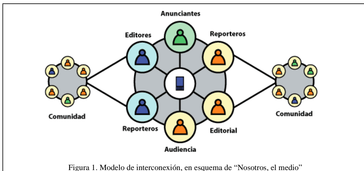
Figura 1. Modelo de interconexión, en esquema de “Nosotros, el medio”

Así, si en la concepción tradicional el esquema de distribución de informaciones es lineal y unidireccional, donde a través de los medios de comunicación masivos los periodistas se dirigen a una audiencia heterogénea, en la visión del periodismo participativo la comunidad es emisora y receptora de los mensajes a la vez, con presencia en todas las instancias de la cadena (ver figura 1). A este modelo el proyecto “Nosotros, el medio” lo denomina interconexión, en donde las noticias van “de abajo hacia arriba”.