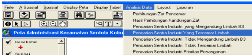
Gambar 4. Menu Analisis Data

Fitur-fitur yang digunakan untuk proses pencarian hasil pengambilan keputusan diantaranya pencarian daerah terkena limbah B3, pencarian sentra industri yang tercemar limbah. Selain proses pencarian, menu ini difungsikan juga untuk perhitungan kadar zat pencemar, menampilkan hasil perhitungan kadar zat pencemar.