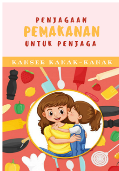
RAJAH 1. Bahan pendidikan bercetak bertajuk “Penjagaan Pemakanan untuk Penjaga Kanser Kanak-kanak”