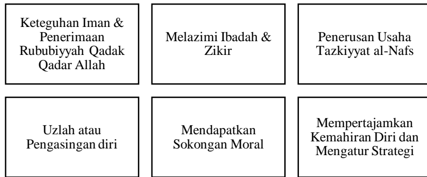
Gambarajah 2: Panduan Pengendalian Emosi Maryam, Ibu Nabi Isa AS

Beliau tidak berkomunikasi secara lisan kerana tohmahan yang dilemparkan melebihi kemampuan fizikal untuk membalas. Namun Allah mengilhamkan kepadanya agar menunjukkan anak kepada mereka seolah berkata; tanyalah anak ini kerana aku tidak dapat bercakap kerana bernazar untuk diam. Diam merupakan satu bentuk reaksi dan komunikasi non-verbal. Akhirnya, Bani Israil tercengang dan tersungkur sujud apabila bayi yang dibawa Maryam itu berkata: " Sesungguhnya aku ini hamba Allah, Dia memberiku al-Kitab (Injil) dan Dia menjadikan aku seorang Nabi. " (Surah Maryam: 30).