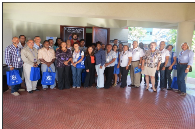
Figura 1. Componentes de los grupos de trabajo para la definición del Plan de acción.