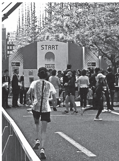
写真1 MGC スタート前、各選手がウォーミングアップを行っている様子

筆者はレース前の6時過ぎにはスタート地点へ移動し、選手のウォーミングアップを観察しながら状態の良し悪しを、解説の判断材料となるよう見極めていた（写真1）。15日の8時50分スタートであったが、機材のトラブルにより2分以上遅れて男子30名がスタートした。このことが多少なりとも選手たちに、主として心理