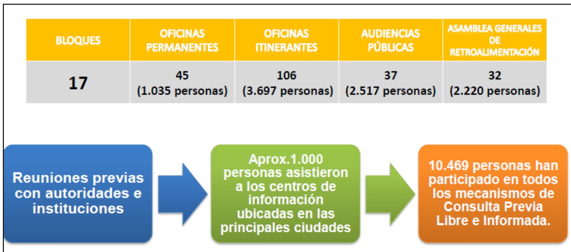
Figura 3. Metodología y número de participantes de la consulta previa