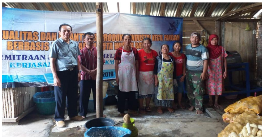
Gambar 5. Hasil dokumentasi bersama pelatihan

Pada Tabel 2 dapat dilihat bahwa rata-rata nilai pemahaman peserta mencapai 85%. Selanjutnya, dokumentasi hasil pelatihan disajikan pada Gambar 5.