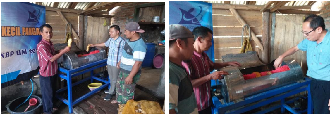
Gambar 4. Tahap Penggunaan Mesin

Pada tahap penerapan mesin pencuci, pada awalnya tim melakukan demonstrasi terlebih dahulu kemudian diikuti dengan warga. Selain itu, juga ada sesi Tanya jawab Kegiatan pada tahap ini ditunjukkan pada Gambar 4.