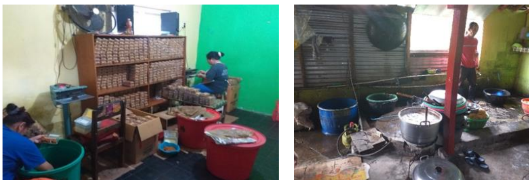
Gambar 1. Dokumentasi kondisi mitra

Permasalahan yang dihadapi oleh Industri pengolahan makanan Carang mas “Novita” adalah proses produksi dan manajemen keuangan. Permasalahan pertama adalah proses produksi, menurut pemilik industri pengolahan carang mas “Novita” adalah proses pencucian bahan bakuyang berupa ubi jalar masih dilakukan secara tradisional yaitu dicuci dengan tangan yang memerlukan waktu yang lama. Kondisi ini akan menghambat proses produksi dan menurunnya kapasitas produksi dan kualitas hasil produk, semestara permintaan pasar yang cukup banyak. Kondisi mitra ditunjukkan pada Gambar 1