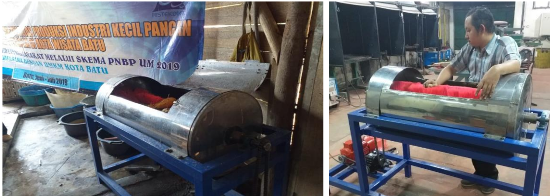
Gambar 3. Tahap Persiapan Awal

tersebut dan Peserta diberi waktu untuk mencoba merakit mesin tersebut. Pada tahap ini dokumentasi kegiatan ditunjukkan pada Gambar 3.