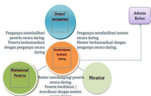
Gambar 2: Model Kedua Pembelajaran Berbasis Daring

Model yang kedua yakni melibatkan mahasiswa, mentor (ditunjuk oleh dosen) dan dosen. Pembelajaran berbasis daring model ini dilakukan secara daring penuh dengan menggabungkan interaksi antara mahasiswa, mentor dan atau dosen.