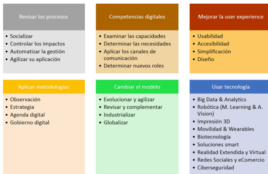
Figura 1. Factores para el éxito.

Actualmente, nos encontramos inmersos en la cuarta revolución industrial o industria 4.0 que exige pasar de puertos electrónicos a puertos interconectados. Este hecho va a producir cambios en los modelos de gobernanza portuaria y no sólo porque se prefiera que los puertos sean más públicos o más privados, sino porque la manera de competir y de ser eficiente será diferente y requerirá una adecuación de la gestión. Todos estos procesos de transformación necesitan básicamente los 6 factores para el éxito que se recogen en la Figura 1.