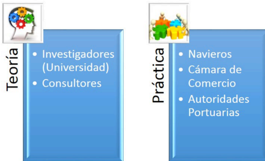
Figura 3. Composición del panel de expertos.

Tal y como se describe en el Cuadro 1, cada grupo de expertos, guiados por un líder, participó en dos rondas de cuestionarios. Cada grupo estuvo formado por equipos homogéneos en número (6 expertos por grupo) y heterogéneos de su composición (ver Figura 3). La selección de los expertos fue minuciosa y se les exigió un compromiso expreso con el proyecto para poder acometerlo en el plazo establecido.