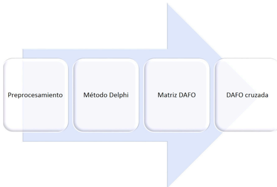
Figura 2. Esquema metodológico.

La metodología adoptada se ajusta al esquema de la Figura 2.