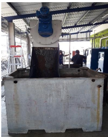
Fig. 1. Lodo residual de la PTAR de TADEL S.A.

Las muestras de lodo residual fueron colectadas en la Procesadora Industrial de Harina de Pescado Secada al Vapor TADEL S.A. Esta se llevó a cabo bajo la metodología de (Medina et al., 2009) la cual consistió en coleccionar cinco submuestras en una cantidad de 1 Kg en la descarga de la línea conductora de lodos hacia un sedimentador en la planta de tratamiento de aguas residuales de dicha empresa, las mismas que fueron homogenizadas y colocadas en envases esterilizados, a temperatura ambiente, para ser transportadas al laboratorio.