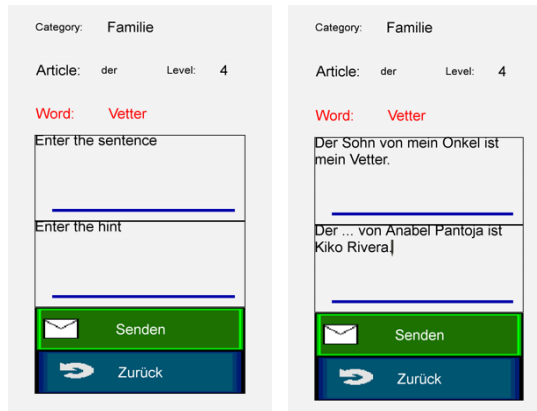
Figura 2. Ejemplo de una palabra descrita por un estudiante del curso.

Una vez que el usuario haya creado e introducido su propia oración ejemplo , esta entra en la base de conocimiento y se pone a disposición de los demás usuarios, que, a su vez, con sus posteriores evaluaciones y reportes determinarán la frecuencia con la que cada oración ejemplo aparecerá en las siguientes partidas.