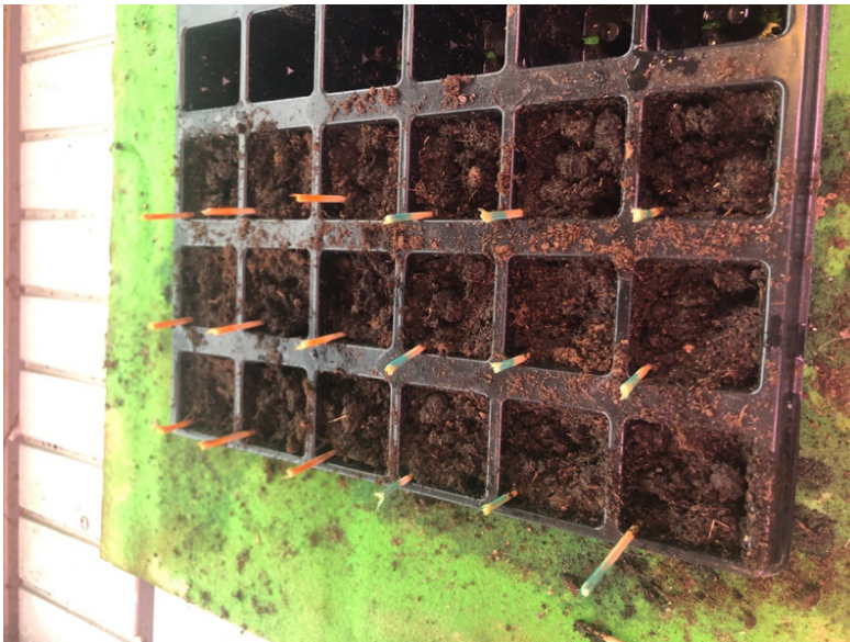
Figur 2 Pottene blomkarsefrøene er plantet i

trenger mye vann, fordi det er en vannholdig plante, og jorden skal holdes fuktig hele tiden («Blomkarse», 2019). Lyset blomkarsene grodde under var Sylvania GRO-LUX F58W/GRO T8, IPC koden er 0001525, teknologien er Fluorescent. Effekten er på 58 watt. Lysets fargesammensetning var for det meste blå, grønn, og rød, som vist i figur 1. Det blå lyset er viktig i starten av prosjektet, fordi det stimulerer vekst, og styrker stilken slik at den ikke knekker (Lunelamper, 2019). Lyset ble målt med et Spektrometer (Pasco). Kaffen som ble benyttet i studien ble laget i en kaffemaskin. Denne kaffen ble tynnet ut med vann i forholdet 1:3 for plantene ble tilført kaffe. Dette ble gjort for at konsentrasjonen av næringsstoffene ikke skulle bli så høy at plantene dør (Hægernes, 2011b).