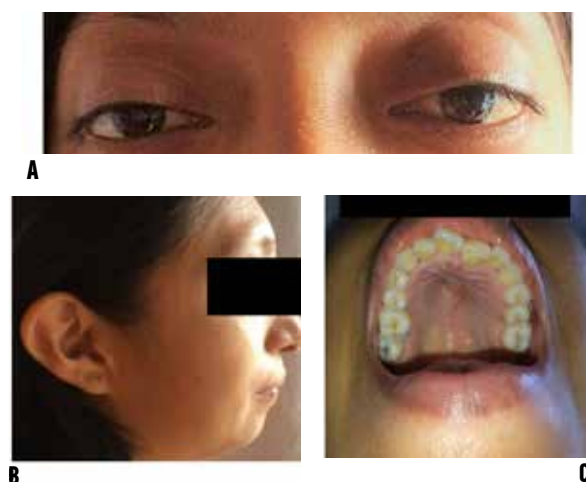
Figura 2. Caso 2. A. Vista anterior, se muestra hipoplasia del maxilar superior. B. Vista lateral, se observa baja implantación con rotación posterior de la oreja. C. Se observa hipertelorismo y proptosis ocular. D. Paladar en ojival.

Caso 2: mujer de 32 años de edad, sin antecedentes patológicos personales. Al examen físico presenta braquicefalia, proptosis, hipertelorismo ocular, estrabismo divergente, paladar en ojival, y orejas de implantación baja con rotación posterior (Figura 2). No ha recibido asesoramiento genético hasta la fecha actual. No se observó alteraciones en sus extremidades superiores e inferiores, por lo que un diagnóstico presuntivo de SC fue hecho.