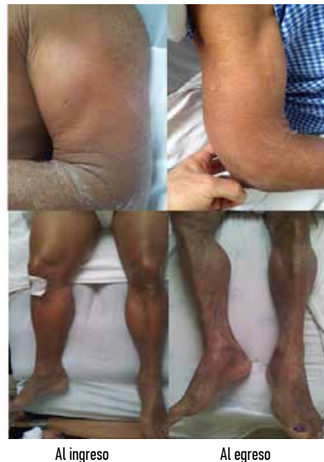
Figura 1. Hipertrofia muscular dolorosa en extremidades y su evolución durante la hospitalización.

Al examen físico en el departamento de emergencia la presión arterial fue 100/60 mmHg, pulso 54 lpm, frecuencia respiratoria 16 rpm, saturación de oxígeno 98% al aire ambiente, temperatura 36.6°C, peso 73 kg, 169 centímetros de estatura. En la inspección la piel lucía seca y descamada con marcada alopecia. A la auscultación del tórax los ruidos cardíacos estaban bradicárdicos, rítmicos y sin soplos; campos pulmonares claros y ventilados. El abdomen se presentó distendido, con ruidos hidroaéreos disminuidos, blando, poco depresible, no doloroso, sin visceromegalias palpables y timpánico a la percusión. Las extremidades eran simétricas y sin edemas, con marcada hipertrofia muscular y dolor a la compresión en brazos, antebrazos, muslos y pantorrillas de ambos lados. (Figura 1).