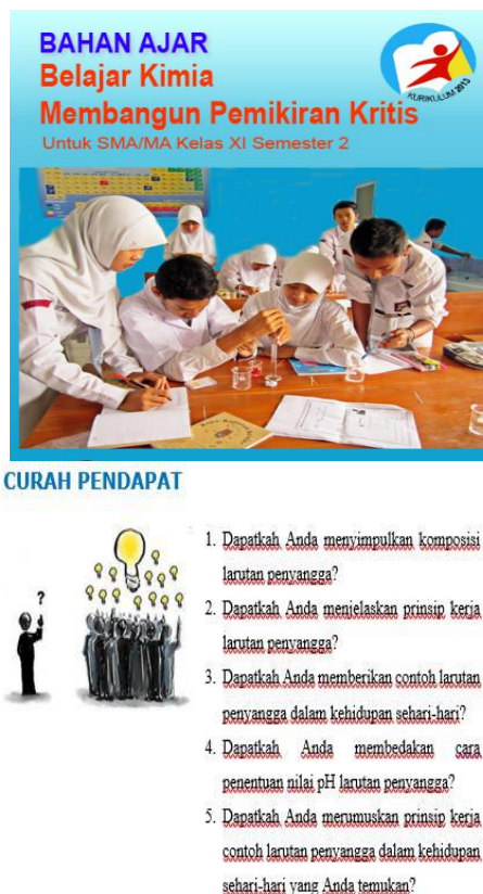
Gambar 1. Halaman Depan dan Contoh Curah Pendapat

Bahan ajar yang disusun dalam penelitian ini didesain mengandung unsur-unsur keterampilan berpikir kritis dengan tujuan agar pebelajar dilatih untuk memiliki keterampilan ini. Pebelajar selama ini belum dilatih oleh guru baik dalam bentuk evaluasi soal maupun dalam desain pembelajaran. Dalam mendesain bahan ajar ini