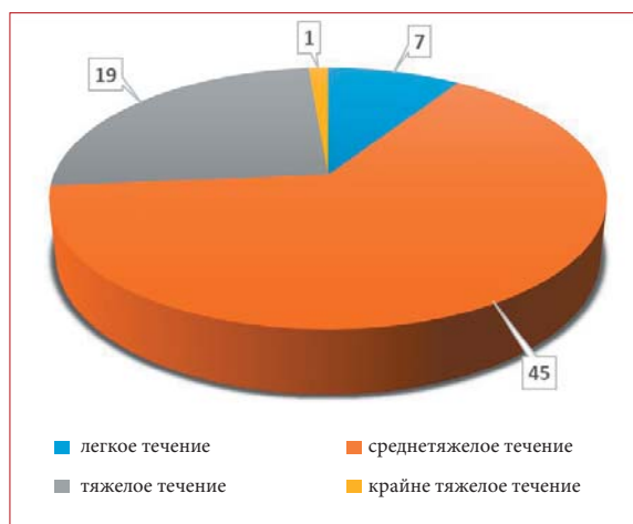
Рисунок 1. Распределение больных с COVID-19 в ГБУЗ РБ ГКБ № 8 г. Уфы по степеням тяжести

Наиболее тяжелые формы развились у больных пожилого возраста, где средний возраст составил 65,3 \pm 10,7 года. Дыхательная недостаточность 0–1-й степени установлена у 51 (70,8%) больного, 1–2-й степени —