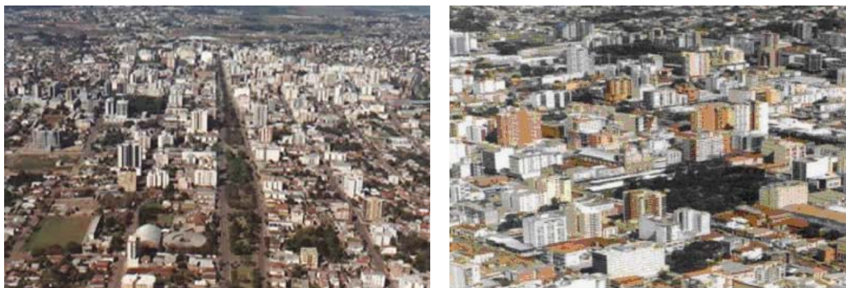
Figuras 03 e 04. Vistas aéreas da cidade de Passo Fundo.