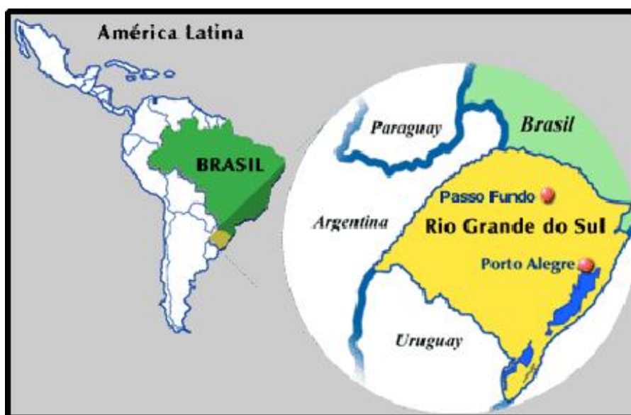
Figura 01. Localização da cidade de Passo Fundo, mapa do Brasil.

Localizada no Planalto Médio, ao norte do Estado do RS, Passo Fundo está a 287 Km distante da capital gaúcha (Figura 01). Com uma altitude de 687 m acima do nível do mar, possui densidade demográfica de 205 hab/Km 2 em uma área de 708,4 Km 2 . O clima é temperado com características subtropical úmido e temperatura média anual de 17,5° C, sendo que a temperatura média do mês mais quente (Janeiro) chegou a 22,9° C e a temperatura média do mês mais frio (Junho) a 12,7° C, com umidade relativa do ar (média anual) de 72%.