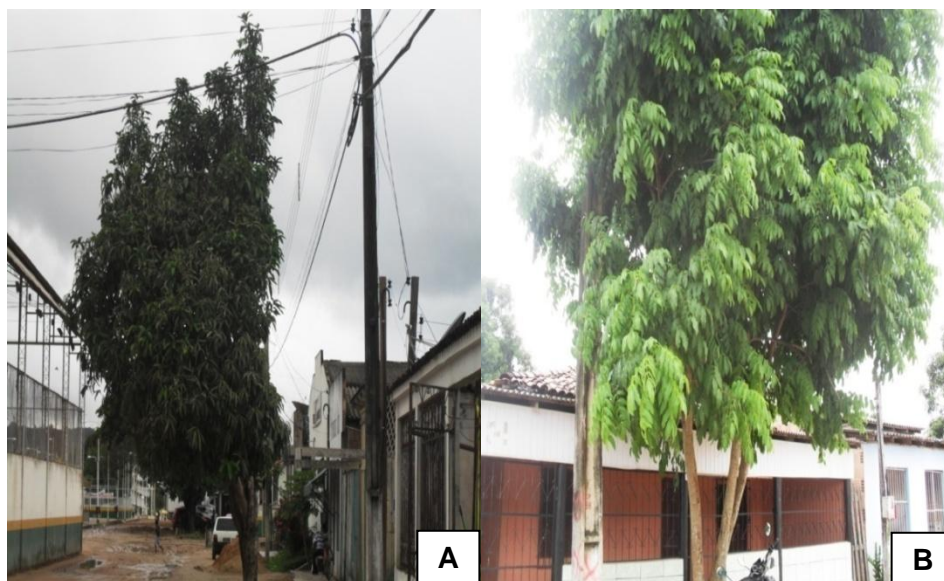
Figura 3. Exemplos de árvores em conflito com a fiação (A) e posteamento públicos (B) na cidade de Vitória do Xingu, Pará