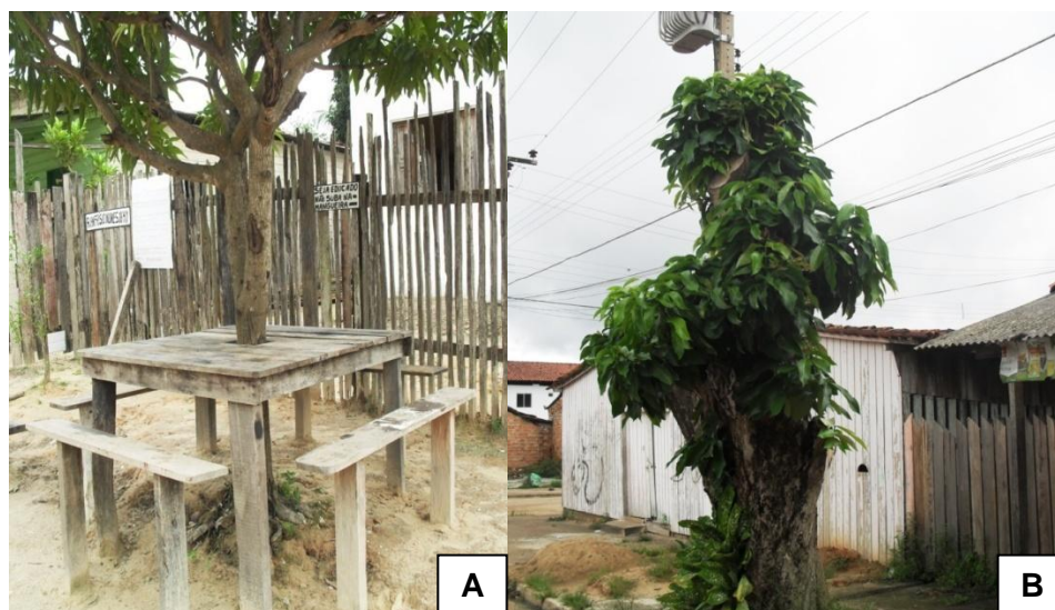
Figura 2. Syzygium malaccense apresentando injúrias: (A) vandalismo; (B) poda drástica, nas vias públicas da cidade de Vitória do Xingu, Pará

se recomendam espécies que apresentem características que favoreçam estas injúrias como as raízes superficiais e que esgalhem muito e a pouca altura, quando o crescimento é mal conduzido, como no caso do Ficus benjamina e do Cenostigma macrophyllum .