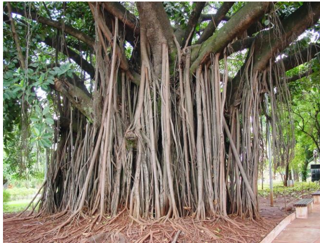
Figura 2. Ficus elastica (falsa-seringueira), na Praça da República (“Praça do Rádio Clube”) Figure 2. Ficus elastica (Indian rubber tree), in Praça da República (“Praça do Rádio Clube”)

Espécies como Bauhinia variegata , Caesalpinia peltophoroides , Eugenia uniflora , Ficus elastica (Figura 2), Licania tomentosa , Magnolia champaca , Mangifera indica , Nerium oleander , Plumeria acutifolia e Terminalia catappa são muito comuns na arborização urbana brasileira (BACKES e IRGANG, 2002; ENERSUL, 2005; MACHADO et al., 1992; PRANCE, 1975; TAMASHIRO e SARTORI, 1999). Porém, outras espécies como Calycophyllum multiflorum , Cariniana estrellensis , Cecropia pachystachya , Guarea guidonia , Inga laurina , Syzygium cumini e Thevetia peruviana , são de uso incomum.