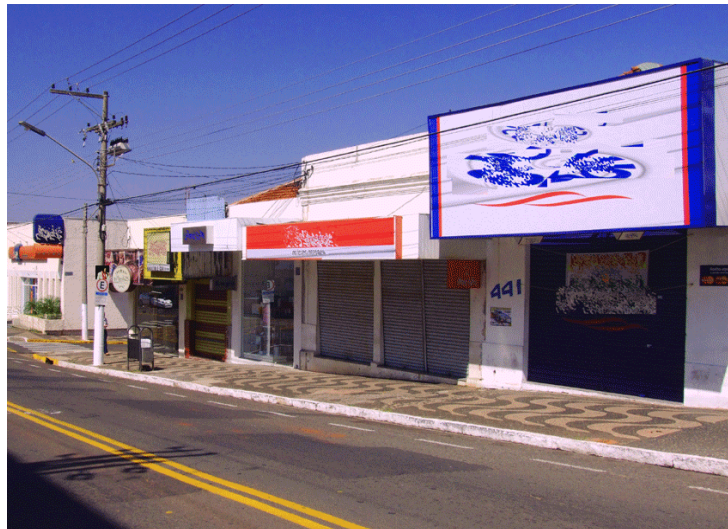
Figura 1: Foto original feita em manhã de domingo.

A primeira fotografia foi feita em uma manhã de domingo – intitulada “domingo” - sem movimentação no comércio, para que as fachadas das lojas e o excesso de propagandas e faixas pudessem aparecer de maneira adequada, sem o trânsito de pessoas e veículos no local (Figura 1). A segunda fotografia foi efetuada em uma tarde de movimento, com o comércio aberto, tendo por título “semana” (Figura 2).