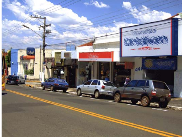
Figura 2: Foto original feita em tarde movimentada.

Em seguida, foram realizadas diversas fotografias de árvores presentes nas ruas da cidade, e estas foram utilizadas na etapa posterior, que consistiu em editar cada uma das fotografias, escondendo as propagandas irregulares e incluindo as árvores de maneira ordenada. (Figuras 3 e 4).