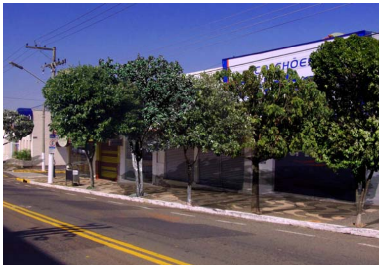
Figura 3: Foto editada feita em manhã de domingo.

Em seguida, foram realizadas diversas fotografias de árvores presentes nas ruas da cidade, e estas foram utilizadas na etapa posterior, que consistiu em editar cada uma das fotografias, escondendo as propagandas irregulares e incluindo as árvores de maneira ordenada. (Figuras 3 e 4).