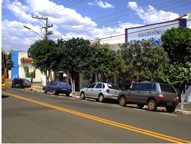
Figura 4: Foto editada feita em tarde movimentada.

O experimento 1 consistiu na apresentação da foto “semana” original para uma amostra de n = 100 indivíduos e a editada para outra amostra de mesmo tamanho. O experimento 2 apresenta fotografias “semana” original e editada para o mesmo grupo de entrevistados ( n = 100 ), alternando a ordem de apresentação das fotografias, de forma que a foto original é apresentada, ora em primeiro lugar, ora em segundo lugar. Os experimentos 3 e 4 constaram dos mesmos procedimentos mencionados anteriormente utilizando-se as fotografias “domingo” com 100 sujeitos em cada experimento.