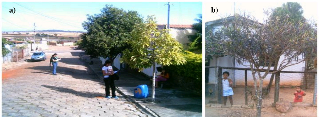
FIGURA 2 - Situações comuns da arborização urbana do município de Goiandira-GO: a) Pavimento de concreto (Setor Central); b) Ausência de pavimento (Setor Primavera) nas calçadas das residências.

FIGURE 2 – Common situations in urban tree planting in Goiandira-GO: a) Concrete pavement (Setor Central); e) Absence of pavement (Setor Primavera) in the residential sidewalks.