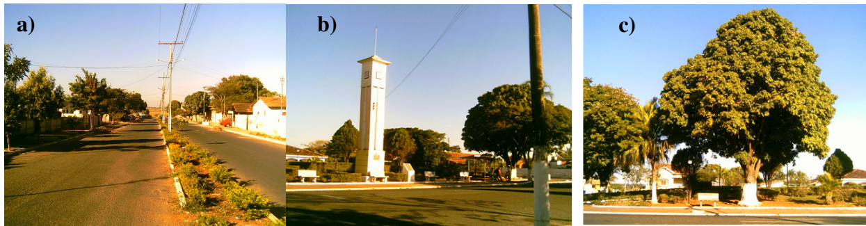
FIGURA 1 - Situações comuns da arborização urbana do município de Goiandira-GO: a) Ausência de canteiro central no Setor Primavera; b) e c) Praça do Relógio, no Setor Central. FIGURE 1 – Common situations in urban tree planting in Goiandira-GO: a) Absence of central flowerbed in Setor Primavera; b) and c) Watch Square, in the Setor Central;