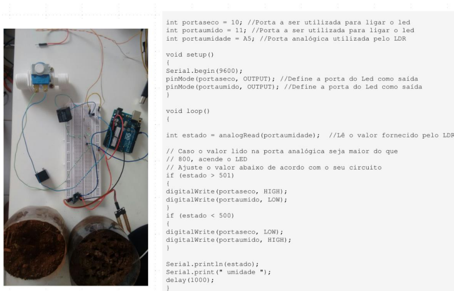
Figura 3. Circuito e Código fonte do protótipo

Durante a simulação na plataforma Tinkercad foram feitos acionamentos virtuais dos sensores e controle de acionamento. Para tanto, no código fonte (Figura 3) foram definidas variáveis que estavam relacionadas com o monitoramento desejado (ex: portaseco; portaumido; portaumidade). Este ensaio avaliou o acionamento dos sensores utilizados e a integridade do programa para carga inicial em um hardware físico e seguindo o esquema de ligação elétrica da Figura 4.