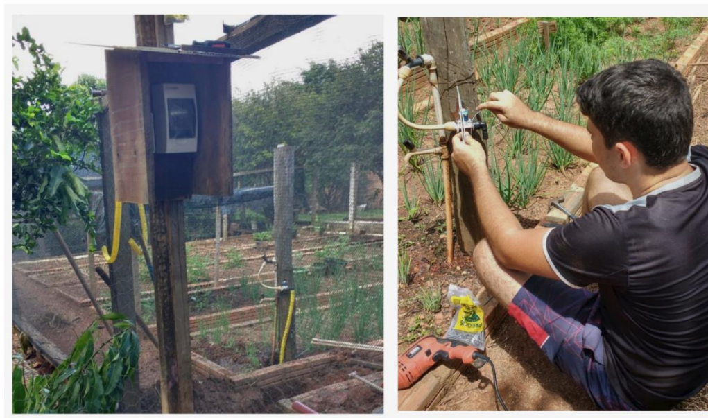
Figura 5. Montagem e testes do protótipo na horta da APAE