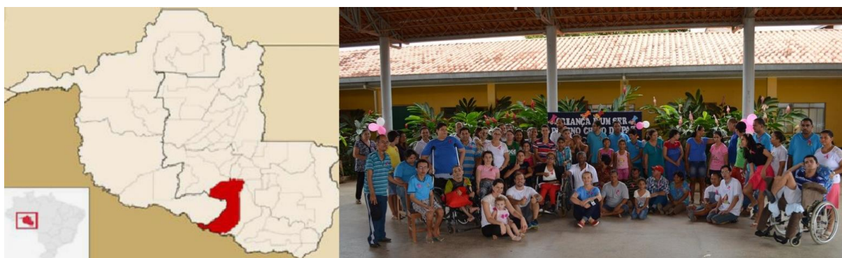
Figura 1. Localização e alunos da APAE