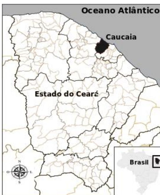
Figura 1. Mapa do Estado do Ceará, destacando a cidade de Caucaia.

A série temporal utilizada neste trabalho são medições horárias da velocidade do vento que foram coletadas a uma altura de 10 m, durante todos os dias dos anos de 2004 e 2005 na cidade de Caucaia, no Estado do Ceará – Brasil, conforme ilustrado na Figura 1. Os dados foram cedidos pela Fundação Cearense de Meteorologia e Recursos Hídricos (FUNCEME). Para os dois anos foram registradas 17448 medições.