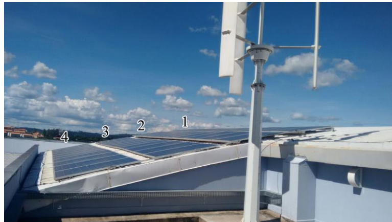
Figura 1 – Vista dos painéis instalados em 4 fileiras.

O sistema a ser estudado é conectado à rede da CEMIG e se localiza na Universidade Federal de Itajubá – Campus Itabira . Ele entrou em operação em Junho/2016 e é composto por 40 painéis da marca YINGLI SOLAR. Na Figura 1 apresentam-se os painéis instalados.