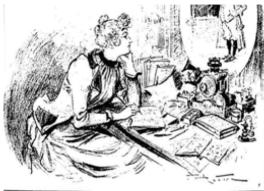
LES COURS PAR TÉLÉPHONOSCOPE.

Para resistir a esta tendência, a que não estão alheios a ideologia da representação fotográfica e, mais geralmente, o funcionamento dos media , foi necessário (e ainda o é) trabalhar “contra o efeito de real”, contra a ilusão da transparência, e aprender a ver, em qualquer imagem, um discurso sobre o mundo, uma organização de formas em que leio o mundo, tanto quanto leio o mundo em mim. (JACQUINOT, 1998)