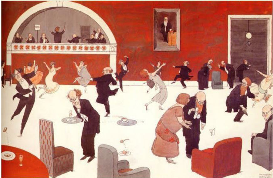
Imagem 5 – “The psychic dance: The annual dance given to spirit medium by the psychological society. Dancing with spiritual partners to spiritual music played on spiritual instruments”, William Heath Robinson.