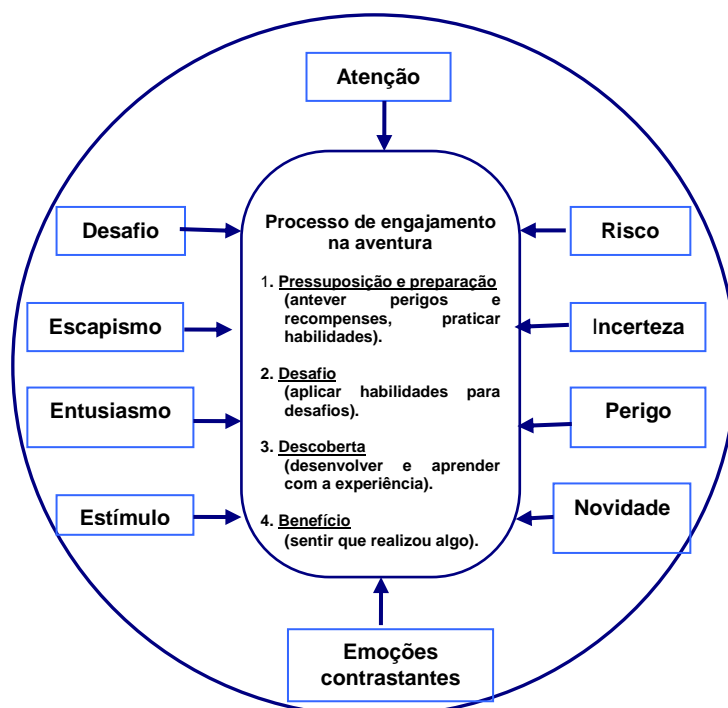
FIGURA 1 - A EXPERIÊNCIA DA AVENTURA