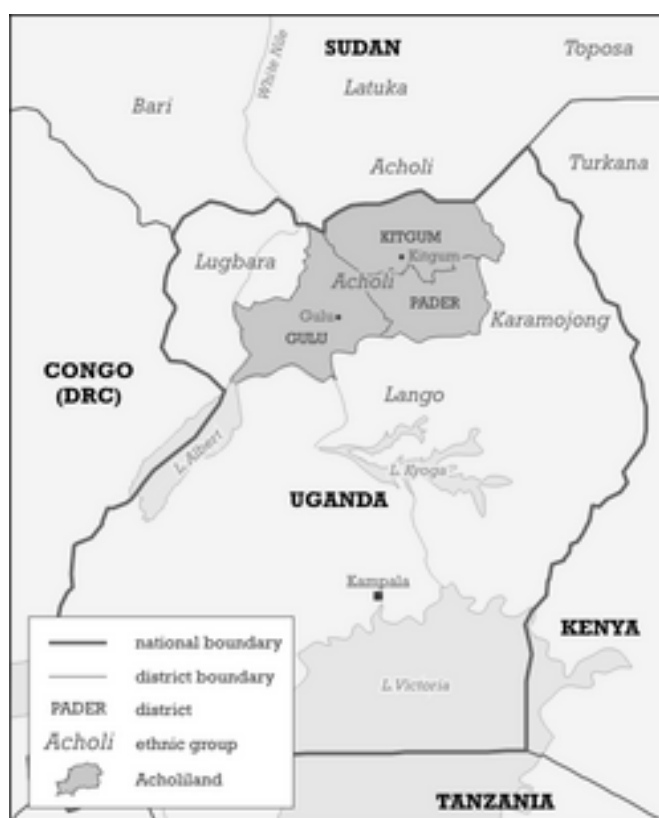
Região habitada pelo povo Acholi, que é vítima da ação do LRA

O LRA é engajado numa rebelião armada contra o governo de Uganda e alimenta um dos conflitos mais duradouros da África. É liderado por Joseph Kony, um acholi de Gulu, que proclama a si mesmo como um espírito de medium e aparentemente deseja estabelecer um Estado teocrático baseado na sua própria interpretação do milenarismo bíblico. O grupo de Kony força seu próprio povo Acholi a se juntar a seu exército através das práticas descritas a seguir.