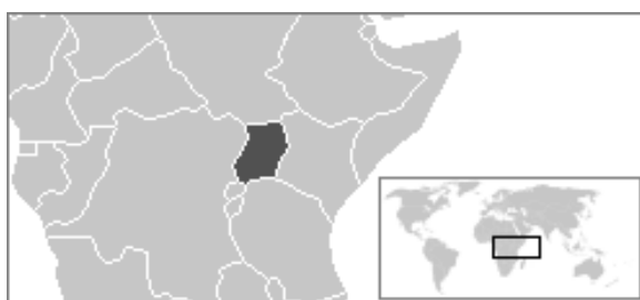
Localização de Uganda

Okello representava o povo Acholi, uma das etnias do norte de Uganda. Um grupo rebelde chamado Lord's Resistance Army – LRA (isso mesmo, Exército de Resistência de Deus) foi formado a partir do ressentimento de parte do povo Acholi, devido a sua perda de influência com a queda do presidente. Resquícios de movimentos que eram originários do antigo Ugandan People Democratic Army - UPDA , que também atuou contra o governo de Museveni entre 1986 e 1988, engrossaram as fileiras do grupo.