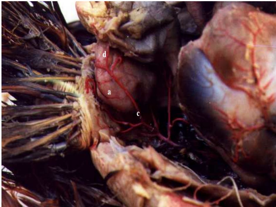
FIGURA 2 – CAVIDADE CELÔMICA DE GALLUS GALLUS DA LINHAGEM LABEL ROUGE, EVIDENCIANDO A BOLSA CLOACAL (A), DESVIADA PARA O ANTÍMERO DIREITO, A ARTÉRIA BURSOCLOACAL ESQUERDA (B) E SUA ORIGEM NA ARTÉRIA PUDENDA INTERNA ESQUERDA (C), ALÉM DE UM RAMO DIRETO DA ARTÉRIA CLOACAL ESQUERDA (D). UBERLÂNDIA, 2002.

Independentemente da sua origem, os ramos arteriais destinados à bolsa cloacal apresentaram-se em número de dois a quatro, sendo dois ramos em 13 casos (43,33%), três ramos em nove casos (30,00%) e quatro ramos em oito casos (26,66%).