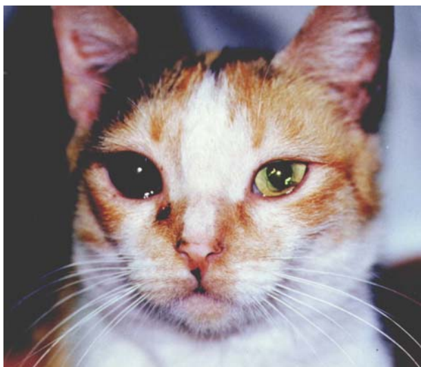
FIGURA 2 – IMAGEM DE OLHO DIREITO BUFTÁLMICO APÓS INSTALAÇÃO DO QUADRO DE GLAUCOMA.

Após a sedação dos gatos com cloridrato de xilazina via intramuscular, injetou-se na câmara anterior de três olhos, na posição límbica de 12 horas, 1,3 ml da solução saturada de grafite (FIGURA 1). Passadas 48 horas, observou-se buphthalmia e pressão intra-ocular superior a 40 mmHg (FIGURA 2) nos três olhos, em consequência do