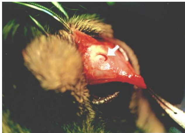
FIGURA 4 – IMAGEM DE ESCLERECTOMIA POR TREFINAÇÃO NA POSIÇÃO DE 12 HORAS DO OLHO DIREITO (SETA).

horas, comprovando a eficácia da e técnica para a produção de glaucoma de ângulo fechado. Nas tabelas que se seguem, verificam-se os resultados obtidos no pós-operatório.