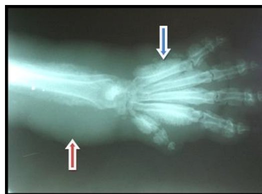
Figura 2: Imagem radiográfica exibindo proliferação óssea do tipo “paliçada” (seta azul) e acentuado aumento de volume dos tecidos mole (seta vermelha).

Após o exame físico o animal foi submetido à medicação analgésica com butorfanol na dose de 0,4 mg/kg por via intramuscular para a realização de exames complementares pois o animal apresentava extremo desconforto a qualquer manipulação. Os exames solicitados foram: radiografia de membros e tórax, ultrassonografia abdominal, e exames laboratoriais. Na imagem radiográfica do membro anterior esquerdo no posicionamento dorso palmar, foram observados os achados radiográficos (figura 2): presença de proliferação óssea do tipo “paliçada” (seta azul) em diáfise de ossos metacarpianos, falanges proximais e intermediárias, e de radio e ulna além do acentuado aumento de volume dos tecidos mole na região avaliada devido o edema (seta vermelha).