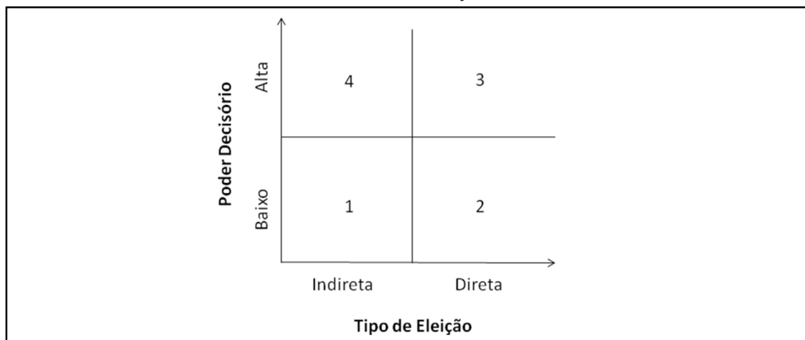
GRÁFICO 1 – PODER DECISÓRIO VERSUS TIPO DE ELEIÇÃO