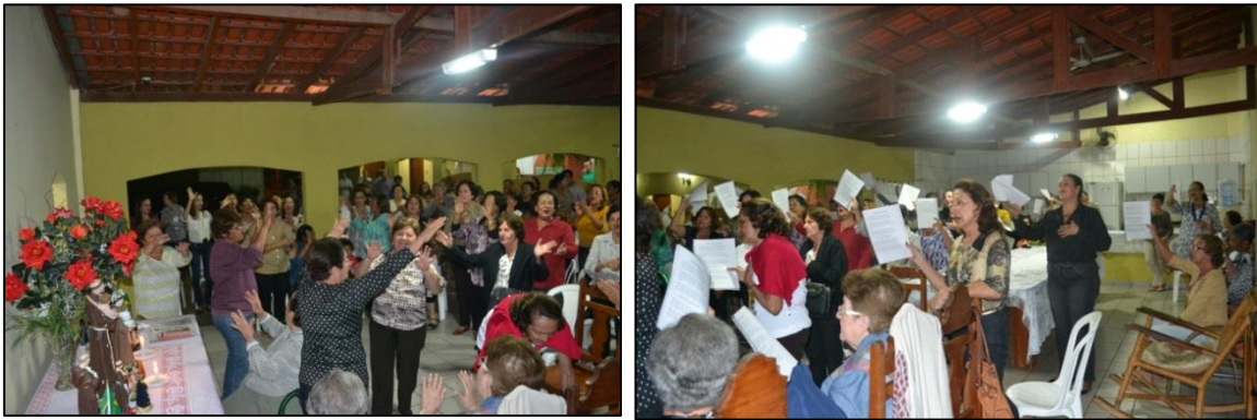
Figura 3. Predominância da participação feminina na Trezena em 2014.

De acordo com Saraiva e Sarmento (2008, p. 01) nas festas religiosas a participação feminina constitui a maioria. Situação que se repetiu na Trezena em Cáceres (Figura 3), considerando que foram elas que preparam e executaram cada dia de celebração, inclusive a organização da missa solene.