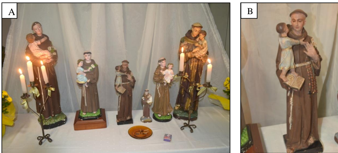
Figura 2. (A) Altar com as imagens de Santo Antônio. (B) Imagem de Santo Antônio que remonta ao final da Guerra do Paraguai.

paraguaios. Após sua morte, a celebração continuou sendo promovida pela família, e também passou a envolver outros devotos e segmentos da igreja católica de Cáceres. No entanto, mesmo se estendendo para diversas classes sociais que ultrapassavam os militares e políticos que constituíam as relações entre as famílias e devotos, observou-se a permanência de processo de convite a famílias as quais são selecionadas por famílias e parte dos devotos.