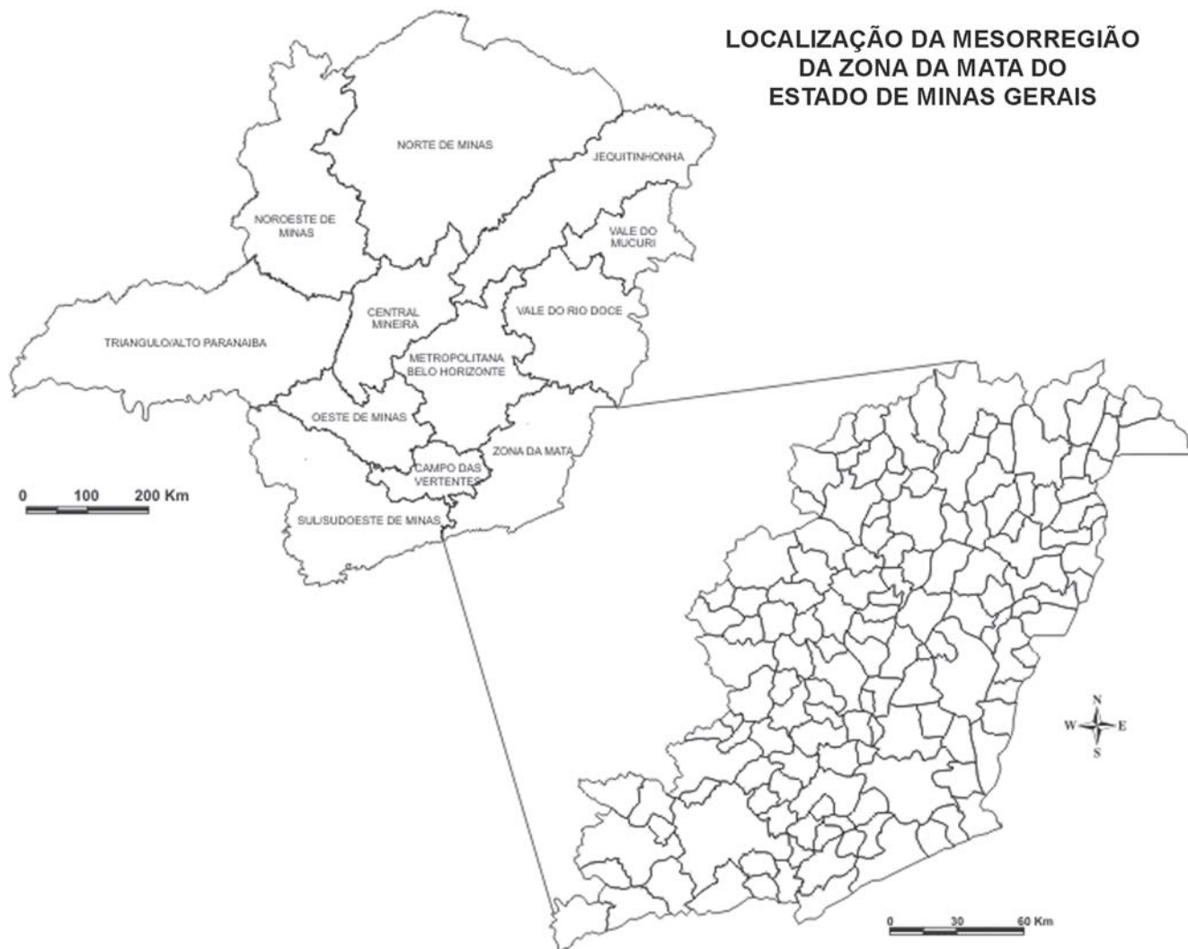
FIGURA 1 - MAPA DE LOCALIZAÇÃO DA ZONA DA MATA DE MINAS GERAIS

A prosperidade trazida pelo café ensejou o primeiro surto de industrialização na região, reforçado, mais tarde, pelas políticas protecionistas implementadas pelo governo federal após a Proclamação da República. Essas embrionárias indústrias eram de pequeno e médio