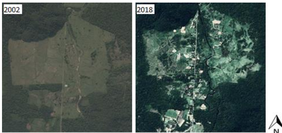
Figura 3 – Imagens capturadas em tela com auxílio do Google Earth Pro. Elaboração do primeiro autor (2019).

Em visitas de campo o aumento da cobertura vegetal é visível e, nesse sentido, entende-se que outras pesquisas de finalidade específica poderiam corroborar em auferir a qualidade ambiental. Não obstante, essa melhora pode ser verificada na visualização das imagens, ainda que não tenha sido realizado um levantamento específico, no intervalo entre 2002 e 2018, por meio de ferramentas on-line como o Google Earth Engine ® , com imagens desde 1984.