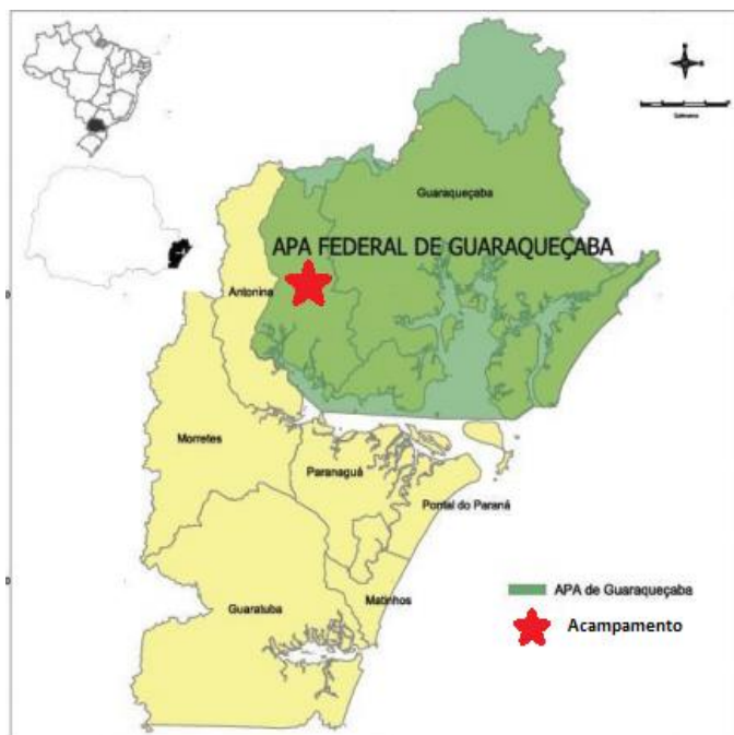
Figura 1 – Localização da comunidade no contexto APA de Guaraqueçaba.

O Acampamento está localizado no Município de Antonina, dentro da Área de Proteção Ambiental (APA) Federal de Guaraqueçaba. A APA Federal de