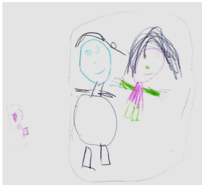
Figura 3. Criança 5, F, 5 anos. Desenhou a si mesma e a avó num banco, esperando a terapeuta chamar, e a porta da sala.

Contudo, as sessões de devolução e orientação feitas com os responsáveis pelos infantes no tratamento deixaram as crianças com dúvidas sobre o que é conversado entre terapeuta e seus pais/avós durante esses encontros. A criança 1 (F, 9 anos), após ter falado que a sua mãe também ia às vezes à sala de atendimento, relatou não saber o que a mãe fazia lá: “Não sei. A mãe não me conta. Não, eu sei. A mãe e a psicóloga conversam. A psicóloga conta as coisas que eu falo pra minha