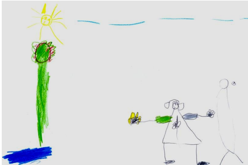
Figura 2. Criança 8, F, 6 anos. Desenhou a si mesma de trancinha. Na roupa um girassol bicudo, uma árvore com maçãs, sol, mar de brincar de pelúcia e nuvens. Ao seu lado, a primeira tentativa de se ilustrar, da qual desistiu.

lhe confiado, tendo esta o mesmo direito à discrição do terapeuta que um adulto tem (Klein, 1975, 1997). Tal vínculo de confiança pôde ser apreendido do seguinte desenho (figura 2), no qual a criança se desenhou “indo pra sala de braços abertos porque eu vou dar um abraço na minha psicóloga” (criança 8, F, 6 anos), evidenciando na criança a crença de que esta poderia se “jogar” e se “entregar” à terapia e ao terapeuta, acreditando que seria amparada e acolhida.