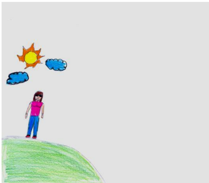
Figura 4. Criança 4, M, 11 anos. Desenhou o sol, duas nuvens, o chão com grama e a psicóloga.

desempenhado por ela, em relação a outras pessoas/profissionais. A criança 5 (F, 5 anos), durante a aplicação do D-E, disse que a psicóloga era amiga dela. Já a criança 8 (F, 6 anos), ao narrar a estória de um desenho em que se ilustrou junto com sua terapeuta, disse: “A minha professora tá contando uma história pra mim” (criança 8, F, 6 anos). Tal mistura de papéis pode se dar pelo fato de a criança, num período inicial da terapia, relacionar-se com a figura do terapeuta, que é nova para ela, a partir de modelos preexistentes. Por isso, pode-se pensar por que é tão comum a criança chamar o psicólogo de médico, doutor, professor ou tio, na busca de