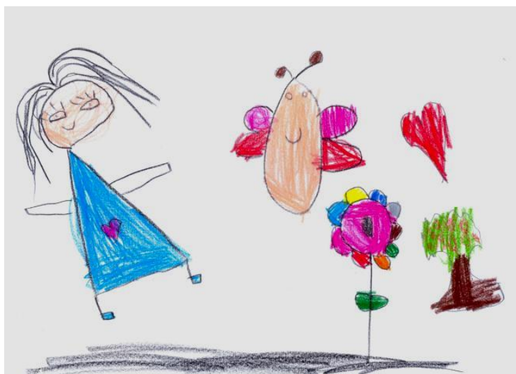
Figura 5. Criança 7, F, 6 anos. Desenhou a psicóloga com um coração na roupa, uma borboleta, uma flor, uma árvore com frutinhas, um coração e terra.

Com relação ao processo terapêutico, para que este se dê é fundamental que a criança estabeleça com o seu terapeuta um vínculo de confiança, sendo necessário, para tanto, que o profissional forneça um ambiente acolhedor, no qual o paciente se sinta seguro para apresentar seus conflitos e elaborá-los. Para tanto, res-