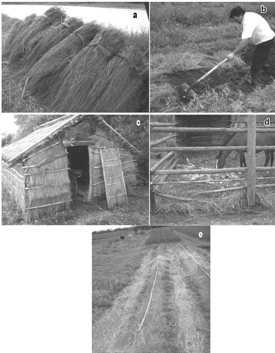
FIGURA 2 – MULTIPLICIDADE DE USO DA MACEGA ( SPARTINA DENSIFLORA ) PELOS AGRICULTORES, SENDO: a = FEIXE; b = UTILIZAÇÃO DIRETA NOS CANTEIROS; c = GALPÃO DE MACEGA; d = CAMA PARA OS ANIMAIS; e = COBERTURA VEGETAL.