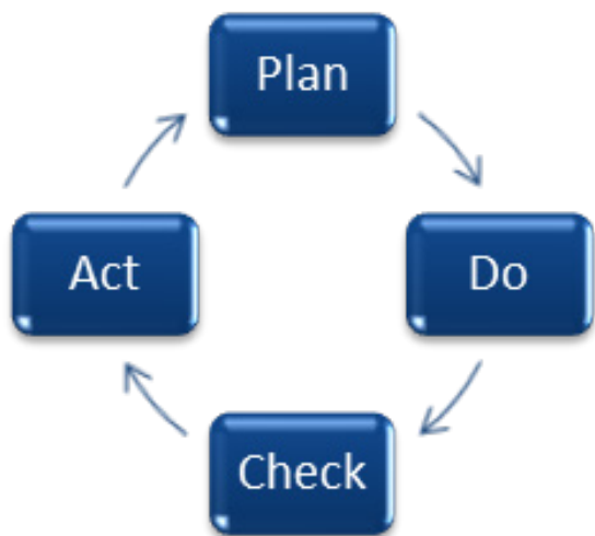
FIGURA 1 – O ciclo PDCA.

A implantação do padrão ISO 14001 assegura que o impacto ambiental das atividades, produtos e serviços dentro da empresa ou organização está sendo mensurado e sistematizado, o que é importante para os gestores e sinaliza compromisso ambiental para com os stakeholders (que são as partes interessadas nas atividades da companhia e incluem funcionários, acionistas, clientes, fornecedores, organizações não governamentais (ONGs), agências governamentais e comunidade local) (Bansal & Hunter, 2003; ISO, 2009; 2015a).