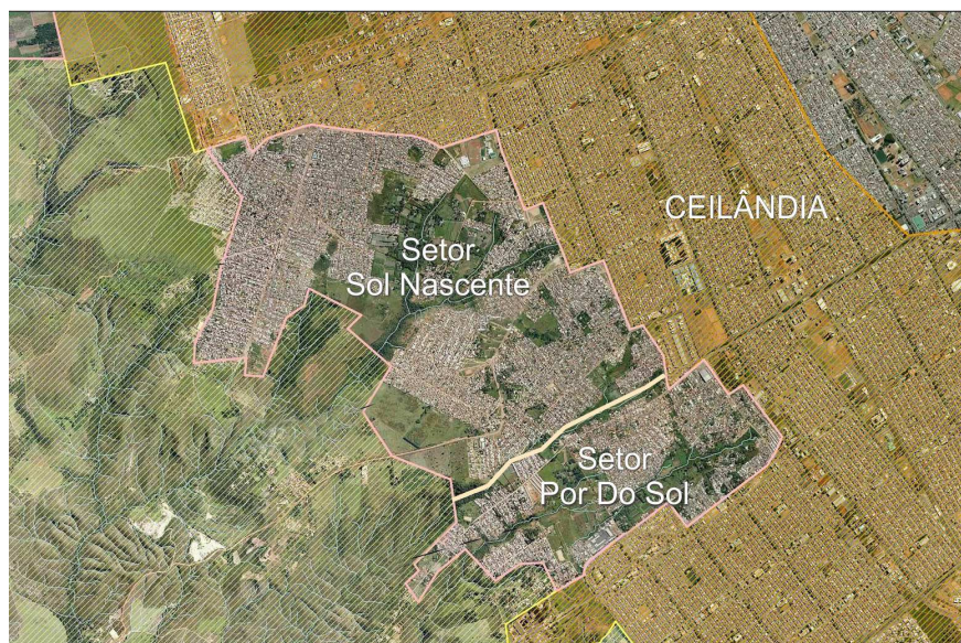
FIGURA 2 – Localização dos Setores Sol Nascente e Pôr do Sol na Região Administrativa de Ceilândia.