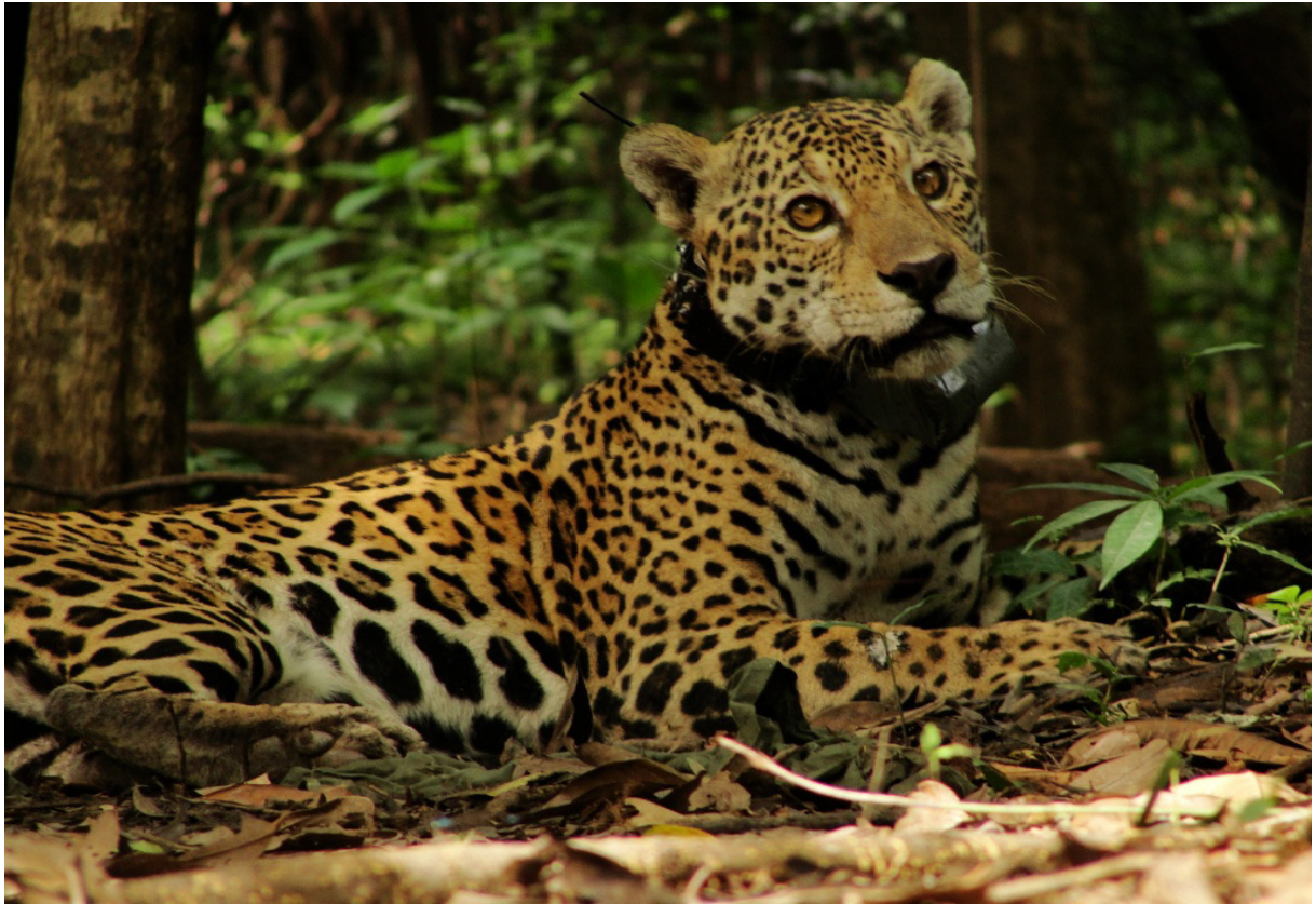
FIGURA 2 – Onça-pintada, floresta, homens, ciência, tecnologia, satélites e ondas de rádio. Onça Jandiá (nome dado pelos pesquisadores) nos arredores do Lago Mamirauá voltando da anestesia após ser equipada com colar de radiotelemetria e GPS.

suadir o abate de onças por produtores rurais. Entre elas: onças estão ameaçadas de extinção; as onças já viviam aqui antes dos homens invadirem seus territórios; matar onças é crime inafiançável; onças estão se aproximando de habitações humanas porque o homem destruiu seu habitat natural; onças matam animais domésticos porque o homem acabou com os animais silvestres que elas predavam naturalmente; onças só atacam reincidentemente animais domésticos se estiverem debilitadas por algum motivo, como injúrias provocadas por tiro ou armadilha, que impedem que elas tenham habilidade para capturar presas silvestres; onças atacam criações domésticas quando o proprietário não toma as devidas precauções para proteger seus animais; onças aprendem a se alimen-