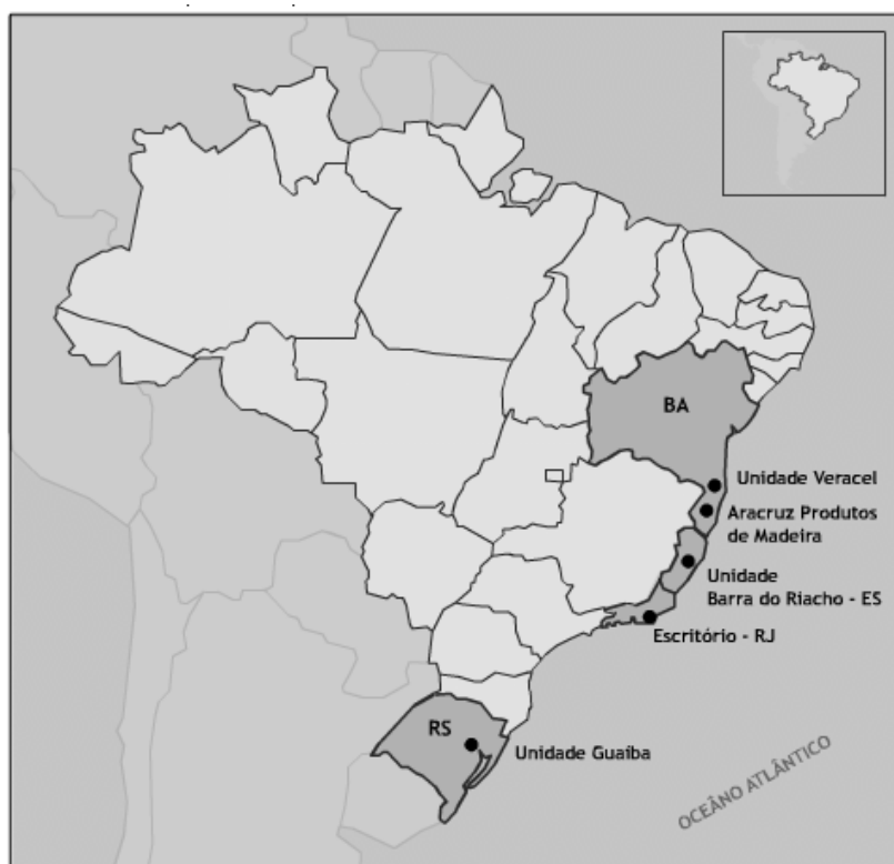
Figura 1: Localização das áreas de estudo

A área de estudo, de propriedade da empresa Aracruz Celulose S.A. está localizada na parte leste e nordeste do Estado do Espírito Santo e no extremo sul da Bahia, conforme apresenta a figura 1.